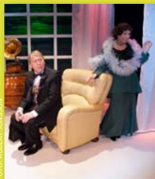
Lördag 17 mars