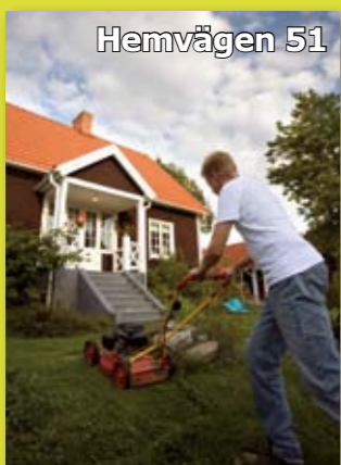
Lördag 28 april