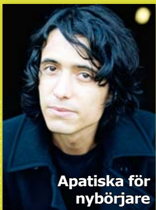
Onsdag 14 mars