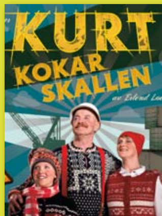
Premiär 24 februari