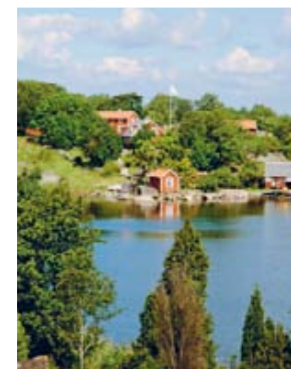
bild över Karlshamns skärgård från inomskärs till havsbandet, från väst till öst. Biljetter löser du vid ombordstigning.