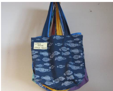
LITEN KASSE MED LÅNGA BAND