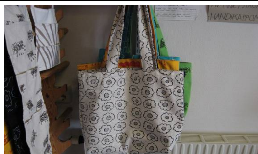
STOR KASSE LÅNGA BAND