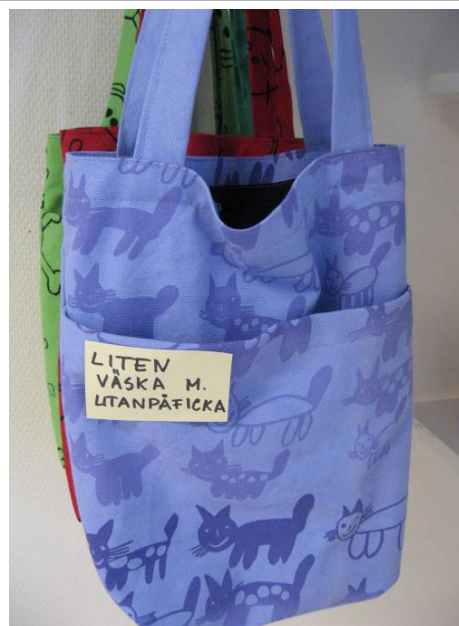
LITEN VÄSKA MED UTANPÅFICKA

Ett urval av alla väskor som sys i AFFÄREN