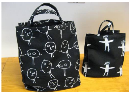
LITEN OCH STOR PAPPERSKASSE