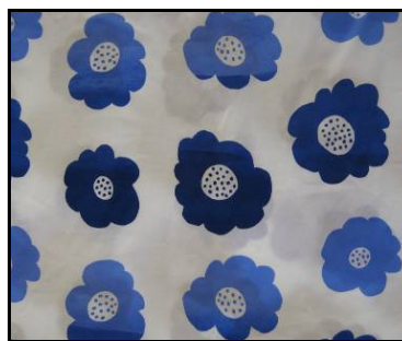
Ett av våra nya mönster