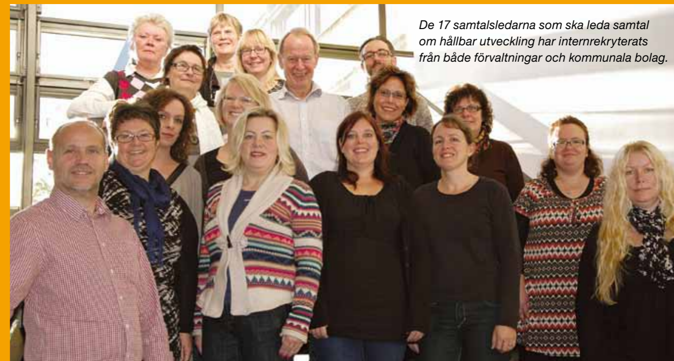
De 17 samtalsledarna som ska leda samtal om hållbar utveckling har internrekryterats från både förvaltningar och kommunala bolag.