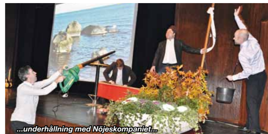
...underhållning med Nöjeskompaniet...