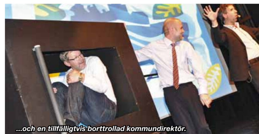
...och en tillfälligtvis bortrollad kommundirektör.