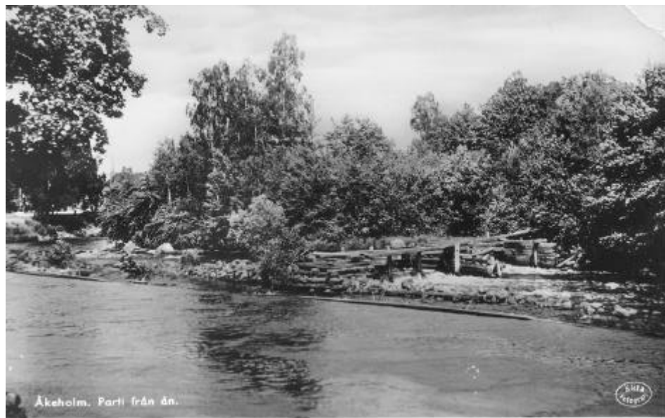
Susekulls övre laxfiske omkring 1930. Laxkaren låg i huvudfåran väster om holmen. En del stensättningar till karen finns ännu kvar.

Det nedre fisket utdömdes 1721 av häradsrätten.