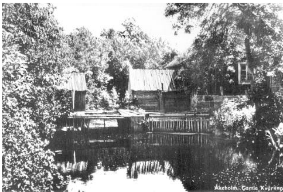
Parti av holmen, sågverket tv på landsidan och kvarnen på holmen. Byggnaderna revs i början av 1960-talet

Det landstycke som förr gick ut i Mörrumsån blev nu istället en avskild holme. Denna holme låg alltså på Susekulls ägor.