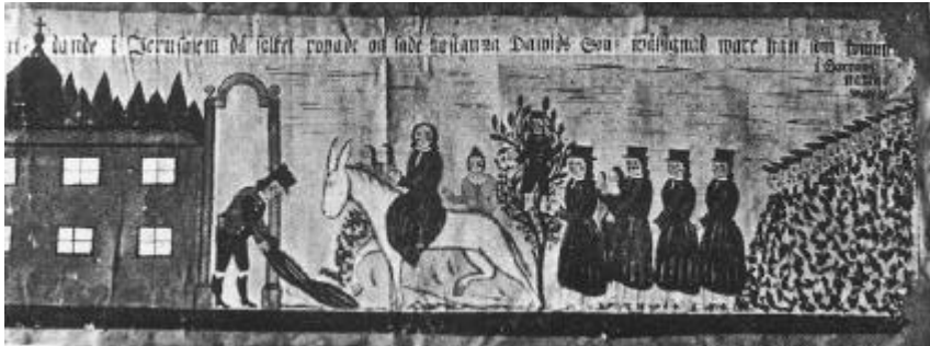
Bonad målad av Trane-Sven 1828. Inridandet i Jerusalem.

En kista målad av Trane-Sven finns bevarad i Ringamåla hembygdsförenings museum, Nissagården i Slänsmåla.