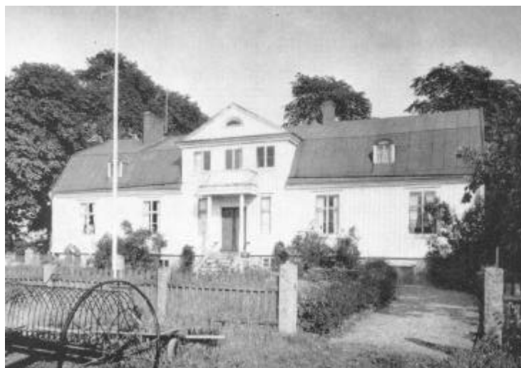
Leissnergårdens mangårdsbyggnad i Torarp.