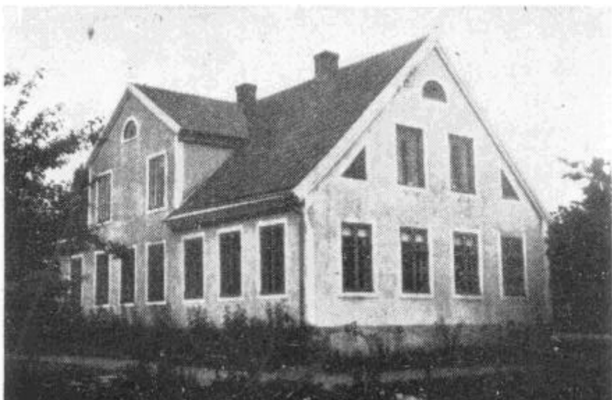
Kylingaryds gård omkring 1940

Idag syns resterna av grunden och den vackra stengårdsgården som omgav gården.