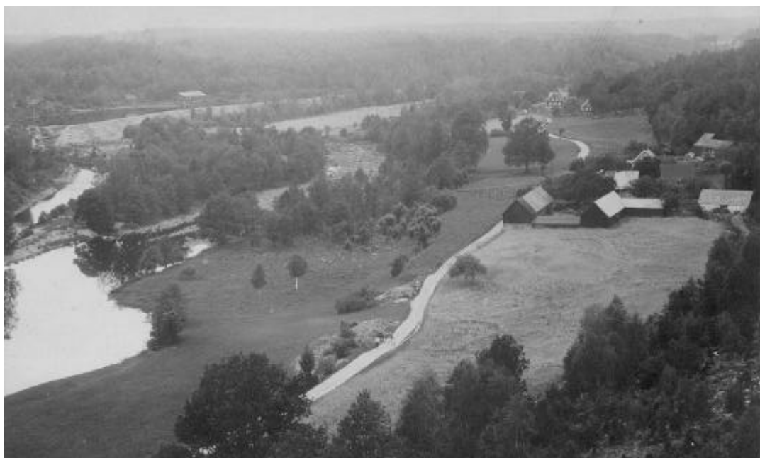
Knaggalids by. Fotot taget från Knaggalids klint omkring 1915. I väster pågår arbetena med Hemsjö nedre kraftverk.

Den tredje, utflyttade gården, ligger 100 m norr om kvarnplanen. Byggnaderna har fränskilts och bildar nu egen fastighet.