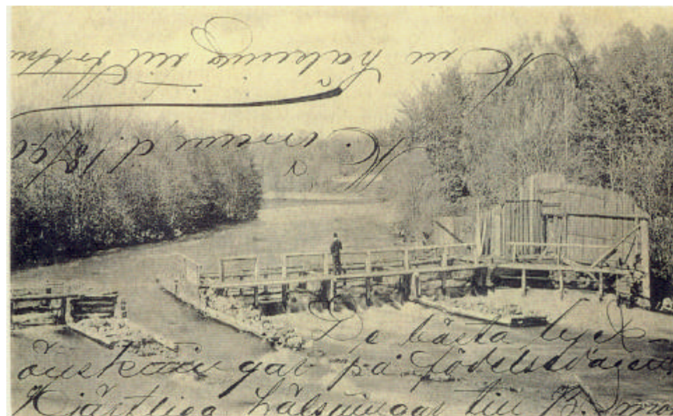
Hönebyggets och Kungsgårds fiske. (Vid tavlans plats)

Fisket restaurerades under 1980-talet och ger en god bild av hur ett laxkar fungerade. Någon lax fångas däremot inte idag.