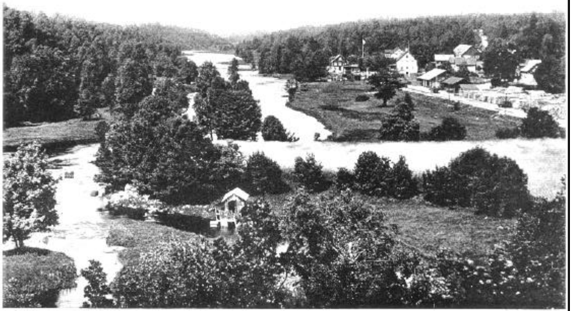
Vy över Hofmansbygd omkr 1900 Foto taget från Telandabacken

Nuvarande markägaren har underhållit torplyckan och den hålls öppen av betande djur. Ruinen efter torpet har märkts ut av Ringamåla Hembygdsförening.