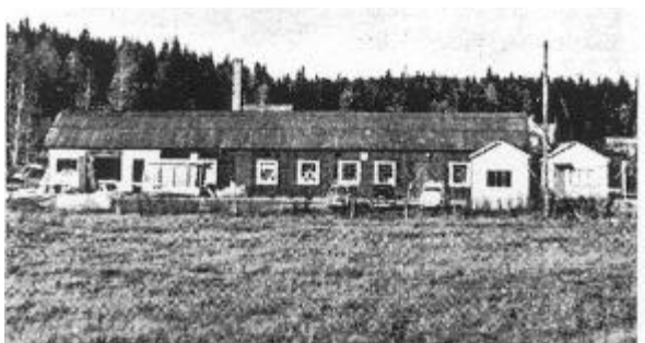
Snickerifabriken före utbyggnaden