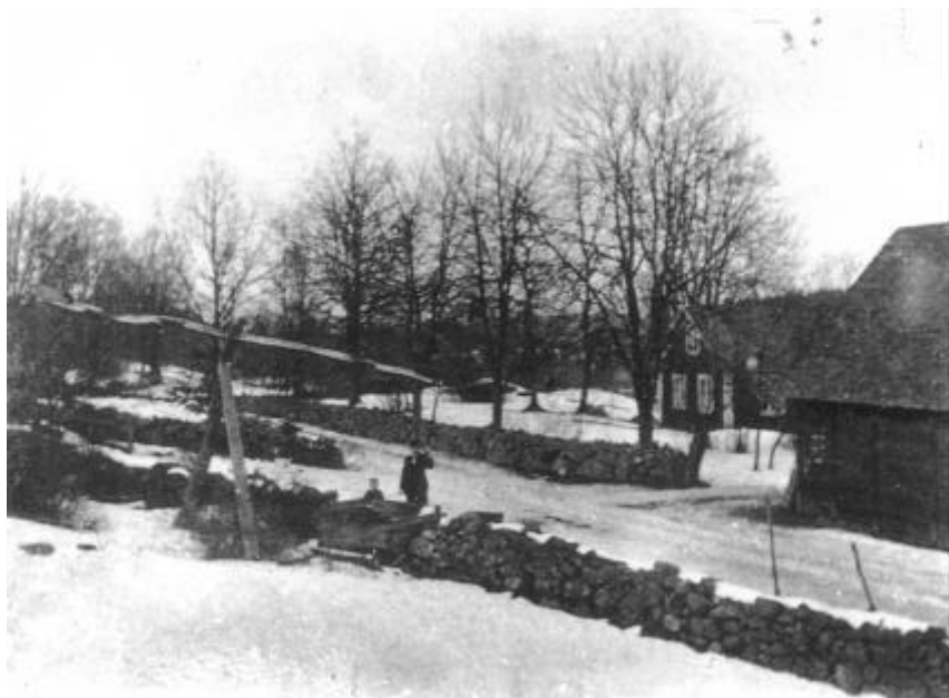
Haldagården som låg där fabriken nu ligger

Man började också tillverkningen av teluret , ett telefonur med vilket man kunde kontrollera telefonsamtalens längd, telecronen som var början till vår telefonsvarare, stickmaskinen , skrivmaskinen och taxametern . Hammarlund var initiativtagare och konstruktör till samtliga.