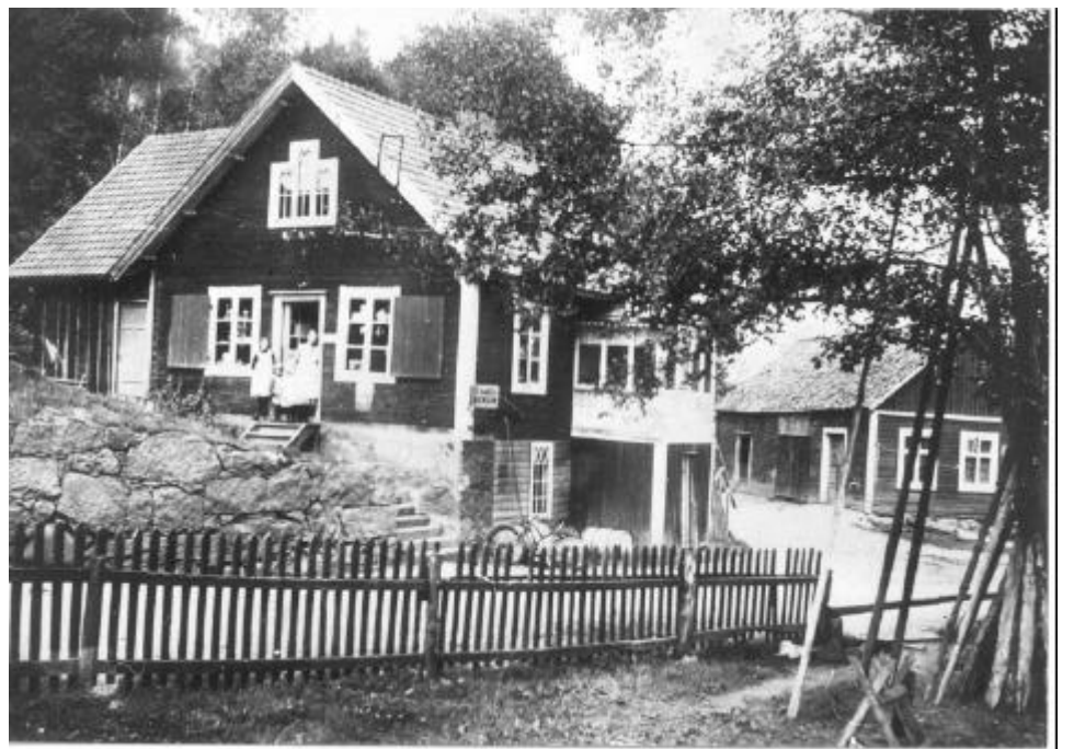
Lanthandeln i Ebbemåla, tidigt 1900-tal. Uthuset t h är idag borta.

Lasta. I partiet mellan Hovmansbygd och Härnäs har man varit tvungen att forsla övrigt gods till lands på grund av starka strömmar och forsar i ån. Omlastningsplatserna där varor lastats från båt till forar och tvärtom kallades lastor. På 1803 års karta var ett område invid ån, ungefär vid nuvarande Ebbemåla Bruk, uttaget som samfärd lastplats. Området kallades Ebbeslätt .