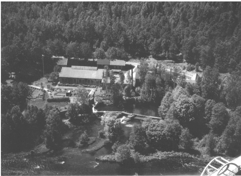
Flygfoto över Ebbemåla omkring 1945. I förgrunden gamla bågbron över Mörrumsån.

Namnet Ebbemåla kan uttydas som Ebbes utmäta område. Namnet skrevs 1611 som Ebbemaale. Måla, måle är besläktat med ordet mål, mått. Det har innebörden avgränsat, uppmätt område. Ebbemåla ligger i Kyrkhults socken.