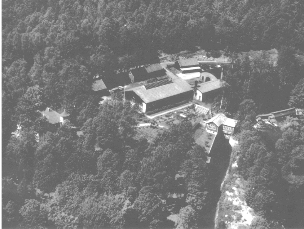
Flygfoto från omkring 1960

På denna plats låg tidigare Ebbemåla såg och kvarn. Den flyttades senare ca 800 m söderut längs Mörrumsån inom Ebbemåla by.