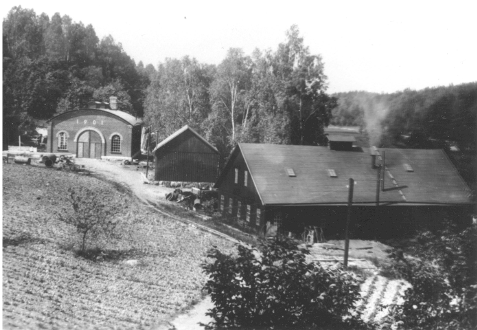
Foto från söder. I förgrunden den gamla verkstaden.

Anläggningen drevs de första åren med kraft från ett vattenhjul, senare övergick man till turbiner. År 1927 revs den gamla verkstaden och en ny modernare mekanisk verkstad uppfördes.