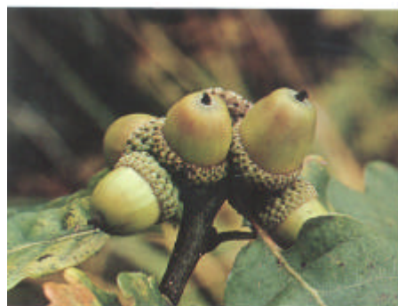
Ollonsamling hos bergeek, druvek.

robustus (stark, hård) och syftar på trädets kraftiga växt och hårda ved.