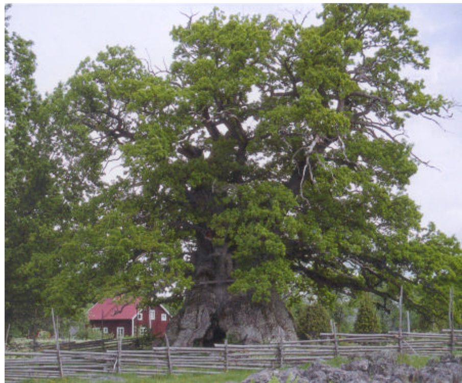
Sveriges största och troligen äldsta ek, Rumskullaeken, finns i nationalparken Norra Kvill i Småland. Omkretsen är tretton meter och åldern omkring 1000 år

I den blekingska historien talas det vid olika tillfällen om män som skövlat våra ekskogar. När landskapet för en tid blev svenskt genom Magnus Eriksson, utfärdade denne kung år 1347, en lag som förbjöd all avverkning av ek och bok, de trädslag som användes vid båtbyggen.