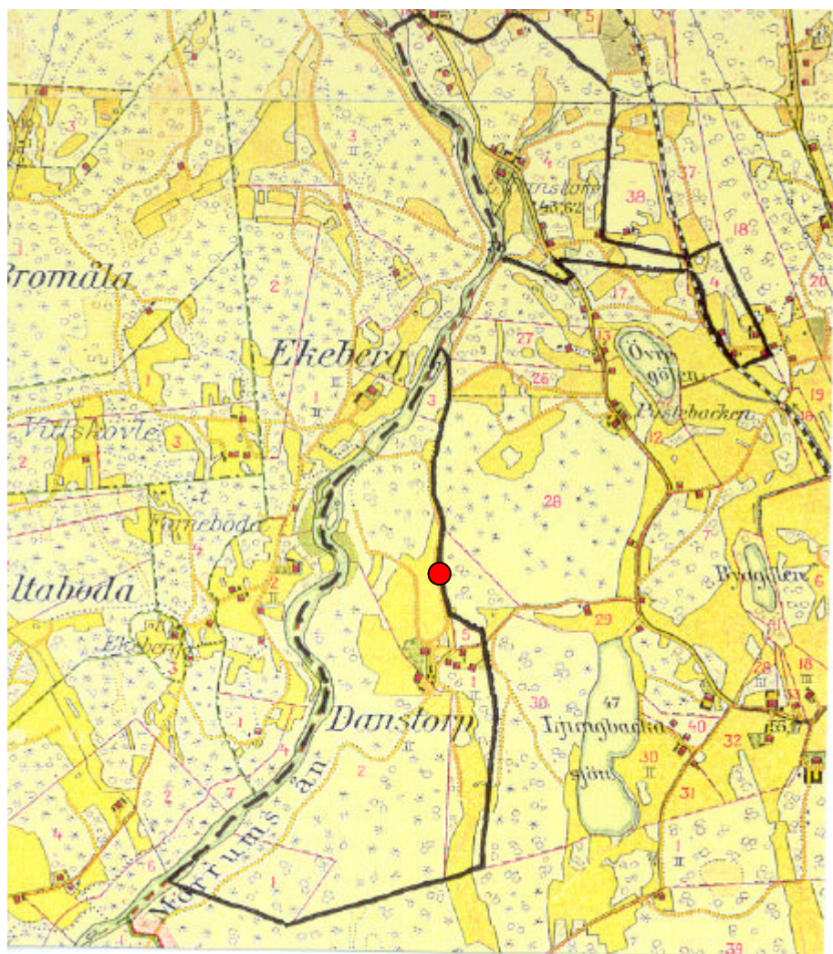
Danstorps by omkring 1915

Det egentliga Danstorp , ligger mellan Gungvala och Mörrumsån. Den andra delen sträcker sig norr om Gungvala fram till Marieberg. Danstorp ligger i Asarums socken .