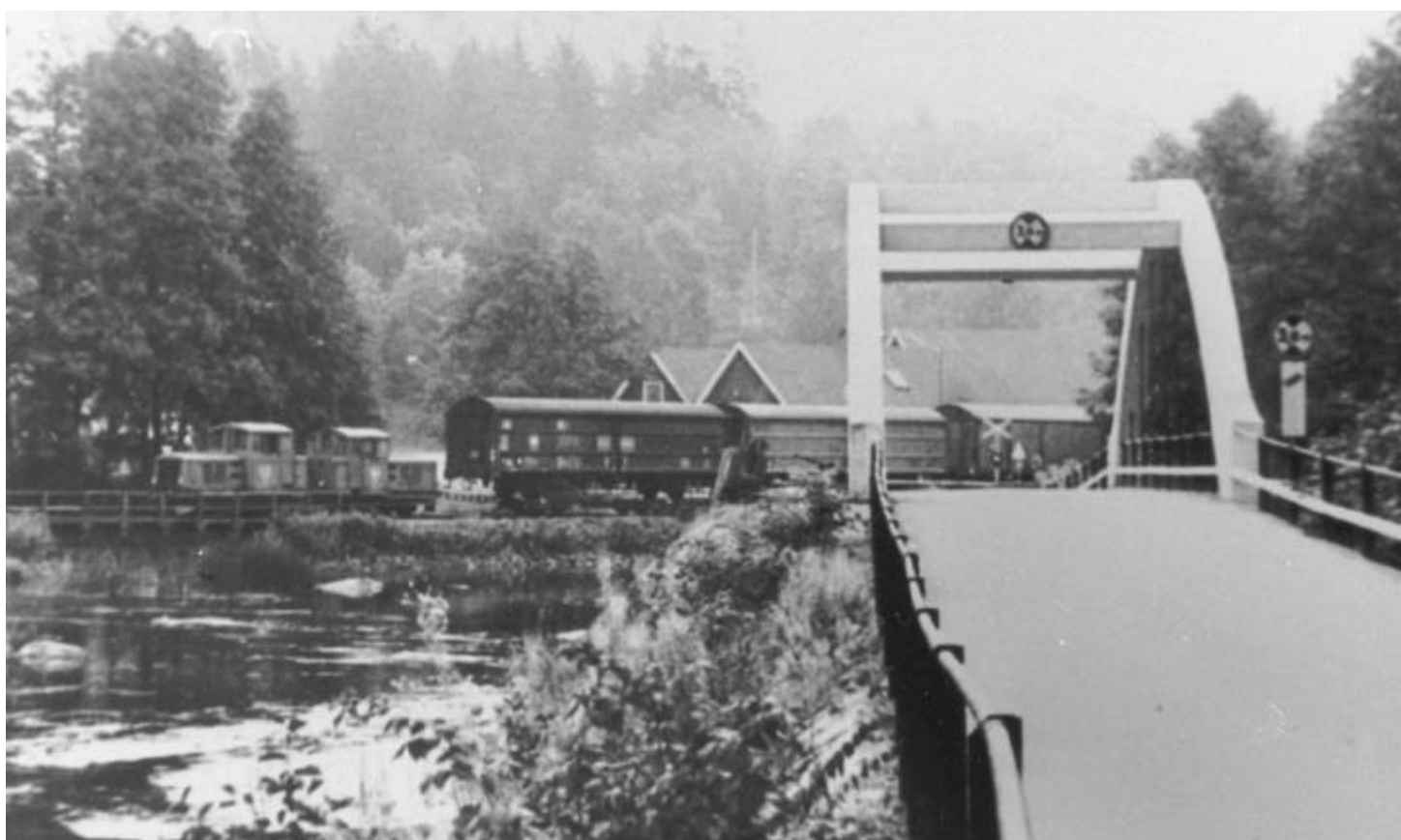
Gamla bågbro från 1932. T v järnvägsbron över kvarnrännans inlopp.

Gränsen mellan Kyrkhults och Ringamåla socknar går i den västra åfåran, närmast Ebbemåla.