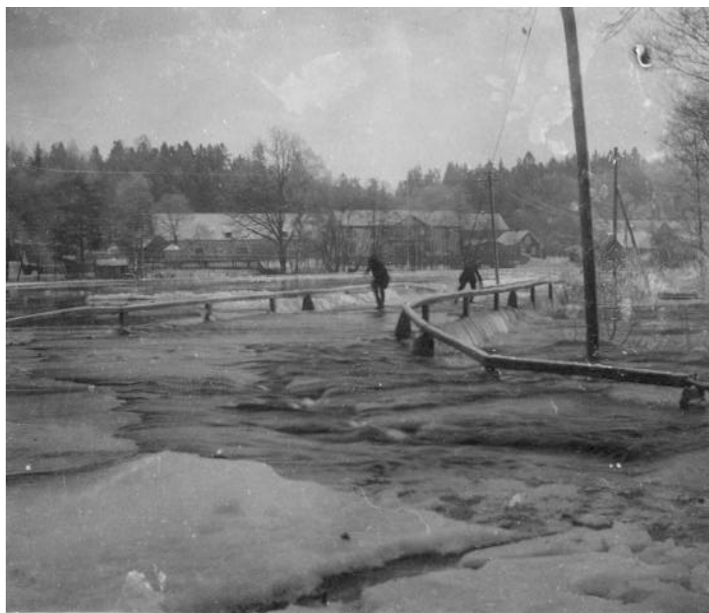
Gamla träbron vid en översvämning omkring 1900

Järnvägstrafiken är nedlagd sedan 1979 .