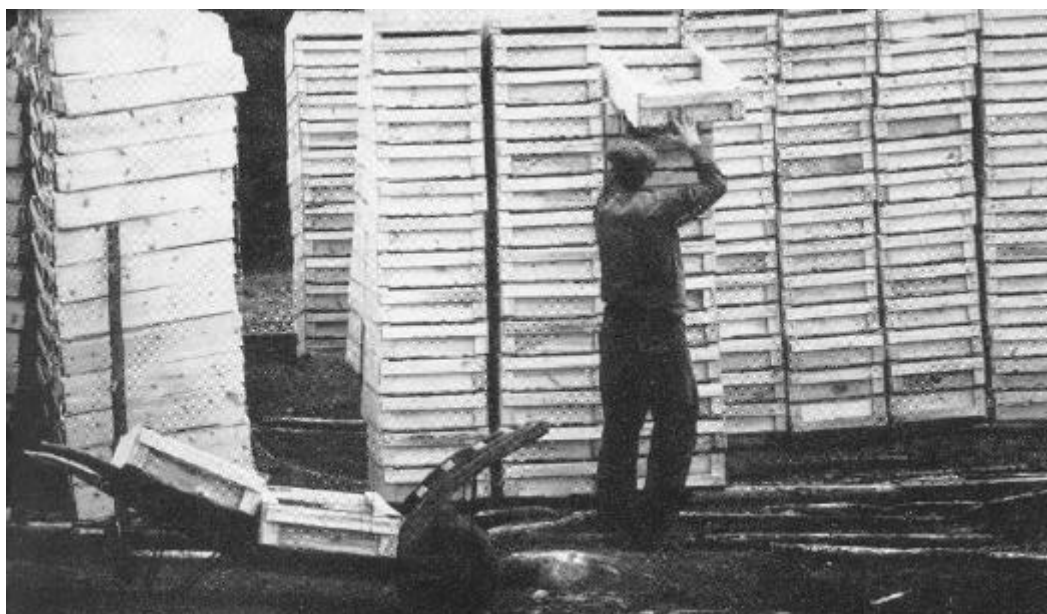
Sillalådor under lådfabrikens tid

Byggnaderna förföll, men 1994 restaurerades den gamla stampen i ett ALU-projekt.