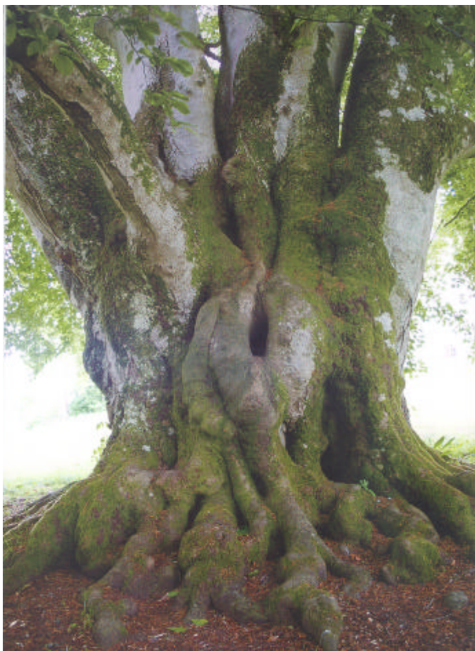
Sveriges största bok står vid Näs slott i Västergötland. Omkretsen är närmare åtta meter och åldern omkring 400 år.

Däremot har den planterats på många ställen i mellersta Sverige som ett tecken på välstånd, något herrgårdarna kunde skryta med under 1600- och 1700-talen.