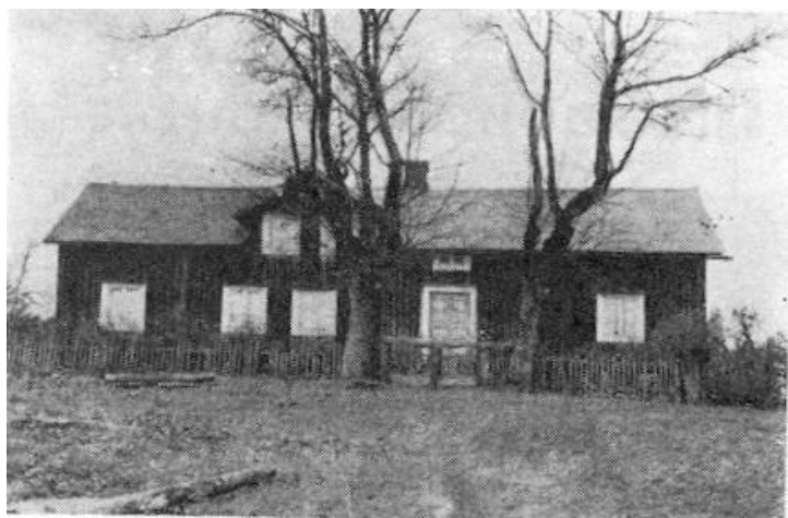
Jössagården omkring 1940

Byns totala yta uppgick till 257 hektar.