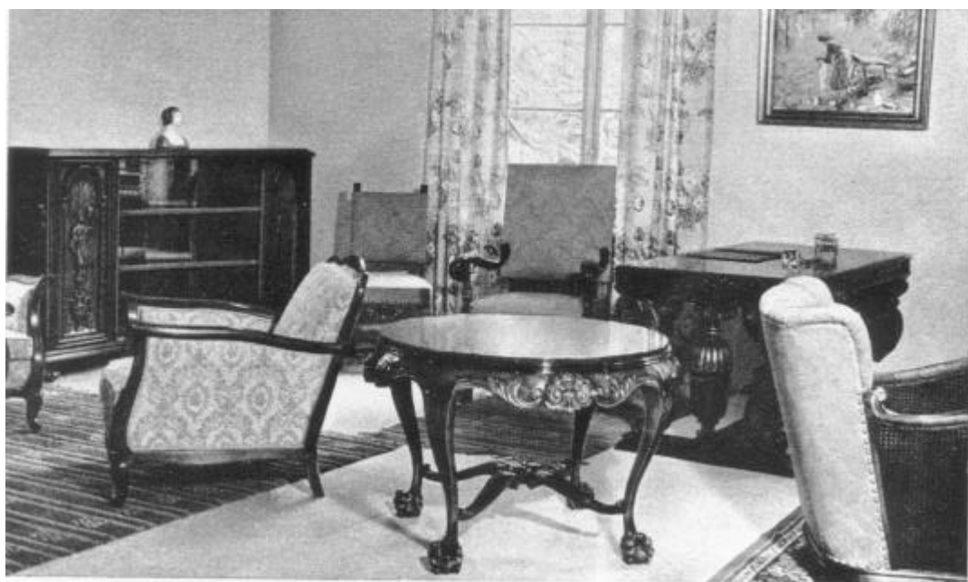
Snickerifabrikens utställningsmöbler vid Karlshamn's Hantverksförenings jubileumsutställning 1947